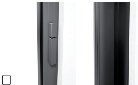
Zonder profielcilinder, draaiknop binnen, drukgreep binnen, zonder komgreep buiten