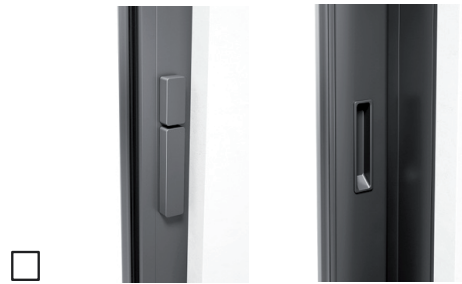
Zonder profielcilinder, draaiknop binnen, drukgreep binnen, met komgreep buiten