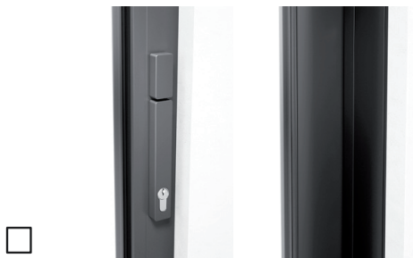
Met profielcilinder (halve cilinder), draaiknop binnen, duwgreep binnen, zonder komgreep buiten