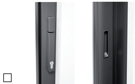
Met profielcilinder (halve cilinder), draaiknop binnen, duwgreep binnen, met komgreep buiten