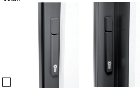
Met profielcilinder (volle cilinder), draaiknop binnen + buiten, drukgreep binnen + buiten

Klink binnen: in systeemkleur (stan daard) anders: _____