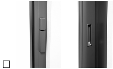
Zonder profielcilinder, draaiknop binnen, drukgreep binnen, met komgreep buiten