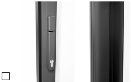
Met profielcilinder (halve cilinder), draaiknop binnen, duwgreep binnen, zonder komgreep buiten