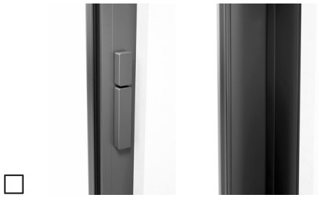
Zonder profielcilinder, draaiknop binnen, drukgreep binnen, zonder komgreep buiten