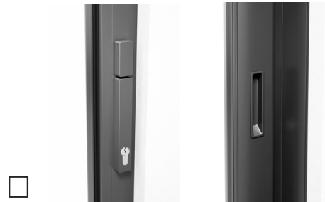
Met profielcilinder (halve cilinder), draaiknop binnen, duwgreep binnen, met komgreep buiten