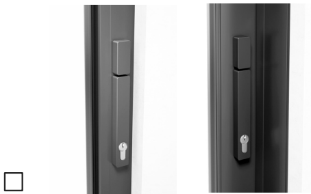
Met profielcilinder (volle cilinder), draaiknop binnen + buiten, drukgreep binnen + buiten

Klink binnen: in systeemkleur (standaard) anders: _____